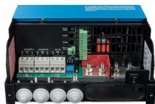
Zona de conexión 12/3000/120-50